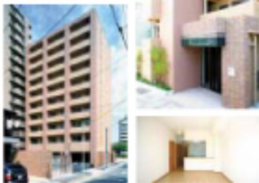
杉本組の一括借上100%完成物件「フルール白鳥」

立地の良い物件を拝見してはいたのですが、例を建てたおかげで分かりました。賃貸マンション経営が良いことは何となく分かっていましたが、経営の知識は同もありません。そこで杉本組を通じて知ったのが、一括借上方式。やる前は不安もありましたが、貴男に左右されることもなく事業ができ、今では本当に良かったと思っています。