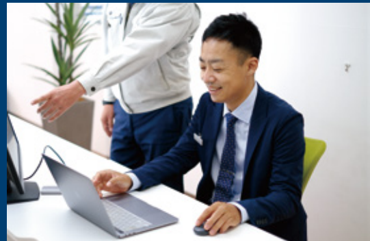
担当/杉本健臣 宅地建物取引士・マンション管理士・管理業務主任者