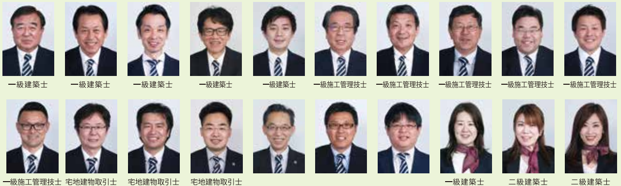
一級建築士 一級建築士 一級建築士 一級建築士 一級建築士 一級施工管理技士 一級施工管理技士 一級施工管理技士 一級施工管理技士 一級施工管理技士 一級施工管理技士 宅地建物取引士 宅地建物取引士 宅地建物取引士 一級建築士 二級建築士 二級建築士