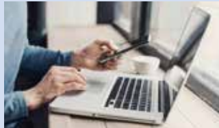
パソコン・スマホ いつでも確認