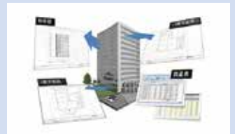
図面の整合性 修正時は関わる図面が自動修正