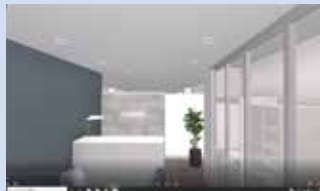
ウォークスルー動画 内観・外観(鳥瞰視点も可)