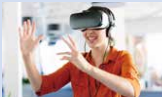
VRプレゼン 形状・高さ・素材・設備等