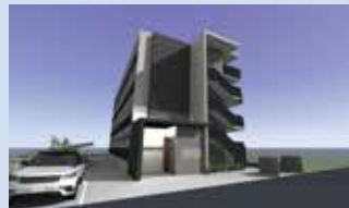
パース生成 アングル自由自在