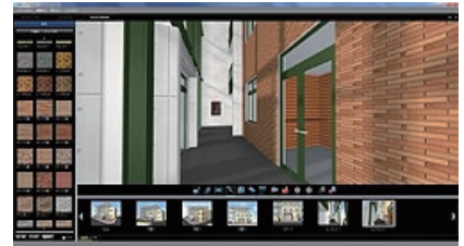
建材情報を確認その場で張替可能