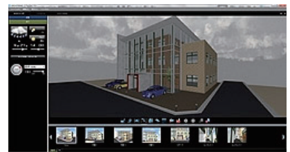
晴・雨など天候別にシミュレーション