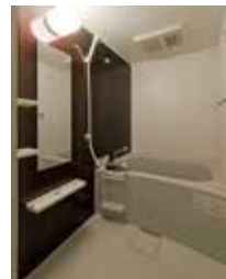
浴槽乾燥機付ユニットバス