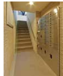
宅配ボックス付 集合郵便受

愛知県で高収益な土地活用を希望のオーナー様、 ぜひこの機会に高収益賃貸マンション「Quattro10」をご検討ください。