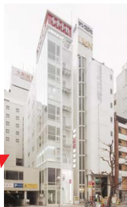
エルテビル 杉本組が間口5m強の狭小地で 手掛けたビル

『狭小地だから土地活用なんて無理』とお考えになる方は多いですが、30坪(100㎡)からでもビルやマンションの建設は可能です。最近のケースでは都心部で中高層のビルに挟まれたオーナー様の自宅跡地に賃貸マンションを建設しました。駅近くであれば10%以上の利回りが可能となります。まずは、「建設費が安く高品質なものをつくり、管理などのトータルサポートができるパートナー選び」から始めましょう。いつでもお気軽に杉本組までご連絡ください。