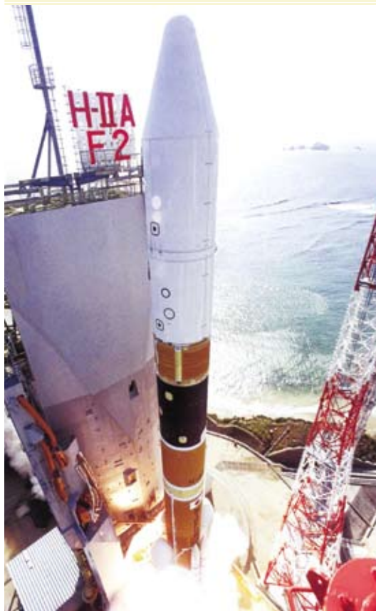
ロケット打ち上げ時の高熱から機体を守る