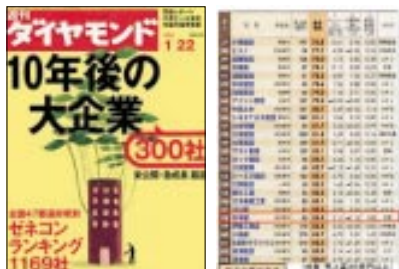
「週刊ダイヤモンド」1月号の特集「全国ゼネコンランキング」にて、当社はトップクラスにランキングされています。