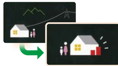
☑ 電気は離れている場所でつくるより使う場所で創ると効率的

発電所と電気を使う場所が離れていると、発電時に発生した熱を上手に利用できません。電気は使う場所で創ると、ロスなく使うことができエネルギー効率が高くなります。エネルギーの地産地消は無駄がなくとってもエコなんです。