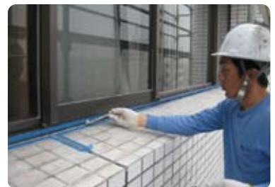
▲ 窓廻りシール施工