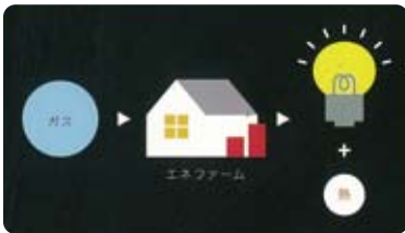
☑ ガスから電気を創り、熱も有効活用

一般家庭で使われる都市ガスから取り出した水素と空気中の酸素を化学反応させて、効率よく電気を発生させます。いつもと同じように電気を使うだけで、発電する際に発生する排熱でお湯を創り、エネルギーを有効利用できます。