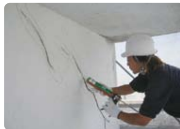
▲ 外壁クラック補修