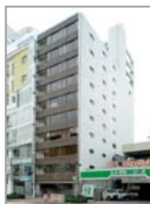
改修前のヒシタビル