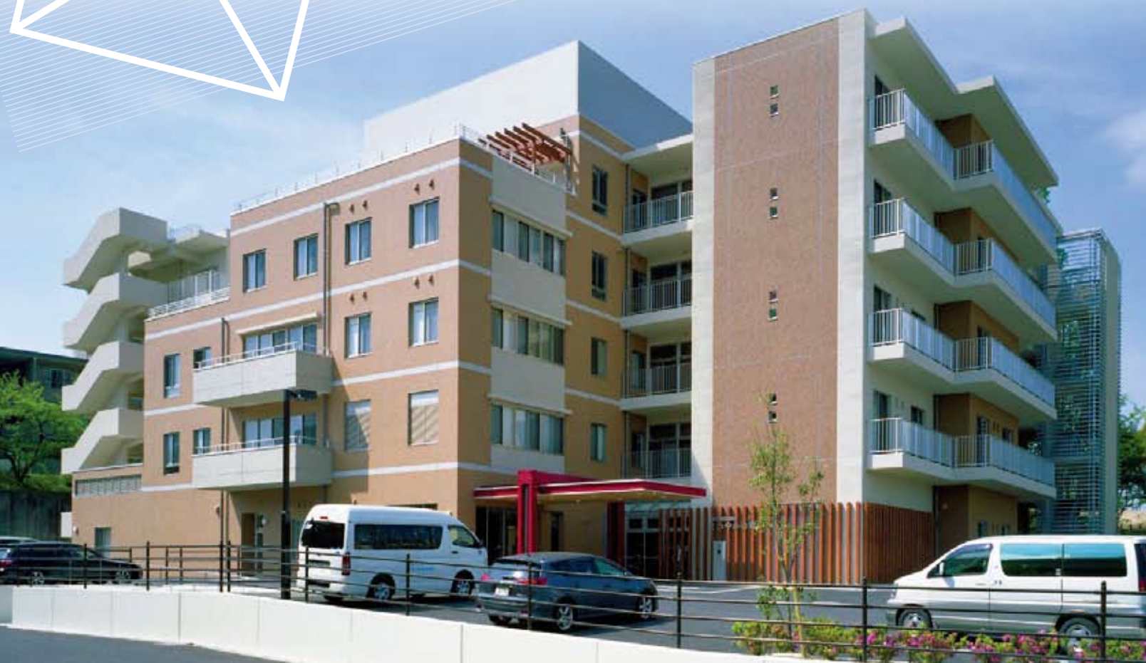
Photo / 特別養護老人ホーム さわやかなの郷 (施工: 杉本組)