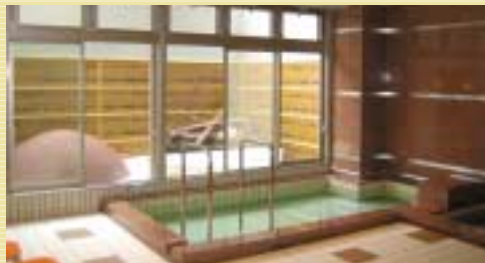
浴室とレストルーム